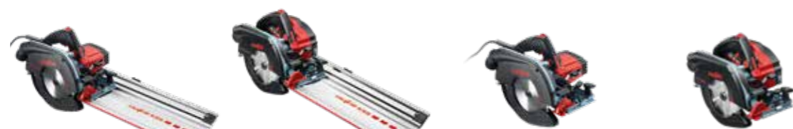
KSS 60 cc