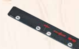
Spojovací článek F-VS

ke spojení s další vodící lištou Obj. číslo 204363