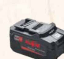
Akku Power-Tank 18M bl