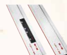
Vodící lišta F