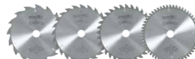
Pilové kotouče HM pro KSS 60 cc / K 65 cc

S novým multi-talentem ve třídě 60/65 milimetrů jste ideálně vybaven pro různé úkoly. Díky speciálně vybavenému příslušenství si můžete zvolit Vaší novou kapovací lištu nebo novou kapovací pilu přesně podle vašich specifických aplikací.