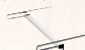
Spodní boční doraz