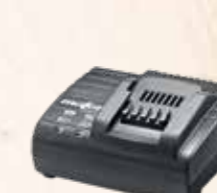
PowerStation APS 18 M

APS 18 M, 18V Obj. číslo 094453 Rychlonabíjecí stanice APS 18 M+ Obj. číslo 094439