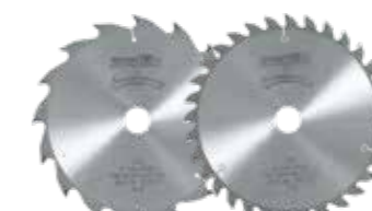
Pilové kotouče pro KSS 60 18M bl