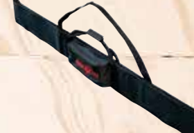
Pouzdro na vodící lišty

APS 18 M, 18V Obj. číslo 094453 Rychlonabíjecí stanice APS 18 M+ Obj. číslo 094439