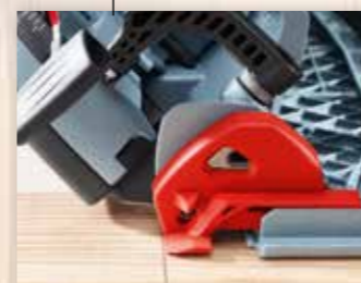
POSUVNÝ UKAZATEL ŘEZU

Světlé LED- svítilny umožňují velkoplošné vyzáření do pracovního prostoru.