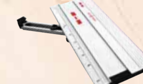
Úhlový doraz F-WA

maximální délka řezu 770 mm Obj. číslo 204378