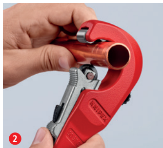
Posunutí řezného kolečka proti řezané trubce pomocí rychlého jednoručního nastavení QuickLock: nejrychlejší nastavení na různé průměry trubek