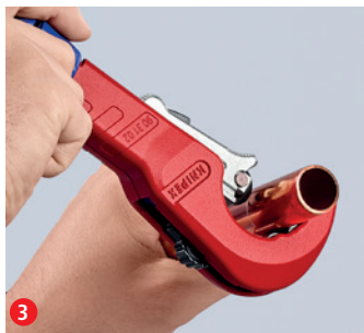
Rychlým otočením proveďte řez a ergonomickým modrým otočným kolečkem upravte nastavení...