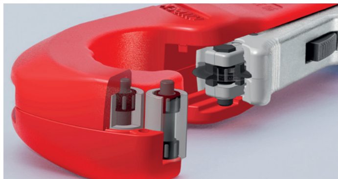
Díky vysoce kvalitním jehlovým ložiskům se řezné kolečko i čtyři vodicí válečky při řezání otáčejí takřka bez obtěžujícího tření – zvláště snadné řezání trubek z nerezové oceli