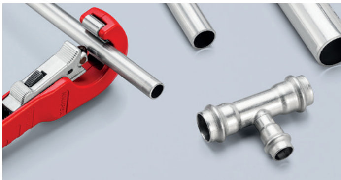
Rychlá každodenní práce: rychlé jednoruční nastavení QuickLock umožňuje jedním stiskem palce posunout řezné kolečko vůči řezané trubce