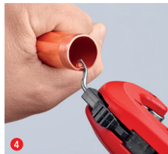
hotovo! Je-li zapotřebí, začistěte okraj řezu rozkládacím odjehlovacím nástrojem – téměř bez námahy