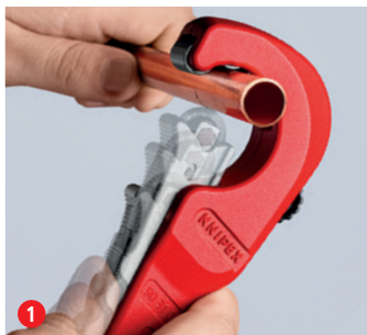
Pro snadné řezání: přiložte otevřený nástroj KNIPEX TubiX®...